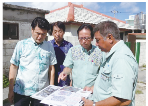
富山町長、知念町議と

現在、住環境の改善や防災性の向上を図るために再開発が計画されています。富山町長に案内いただき、現地視察しました。今後、地元の知念町議と力を合わせて取り組んでまいります。